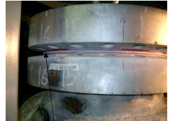
にじみが認められた箇所